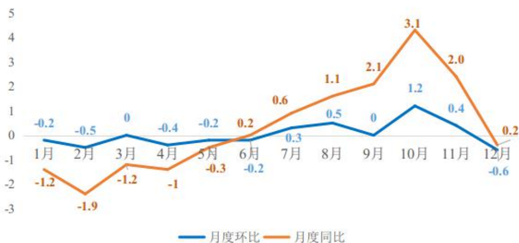
图3 2022年莎车县居民消费价格月度涨跌幅度

全年居民消费价格（CPI）比上年上涨 0.3%。商品零售价格上涨 1.8%，工业品价格上涨 2.5%，消费品价格上涨 0.5%。从八大类看：食品烟酒类下跌 1.8%，衣着类上涨 1.3%，居住类上涨 0.6%，生活用品及服务类上涨 0.8%，交通和通信类上涨 4.5%，教育文化和娱乐类下跌 0.1%，医疗保健类上涨 0.2%，其他用品和服务类上涨 1.3%。