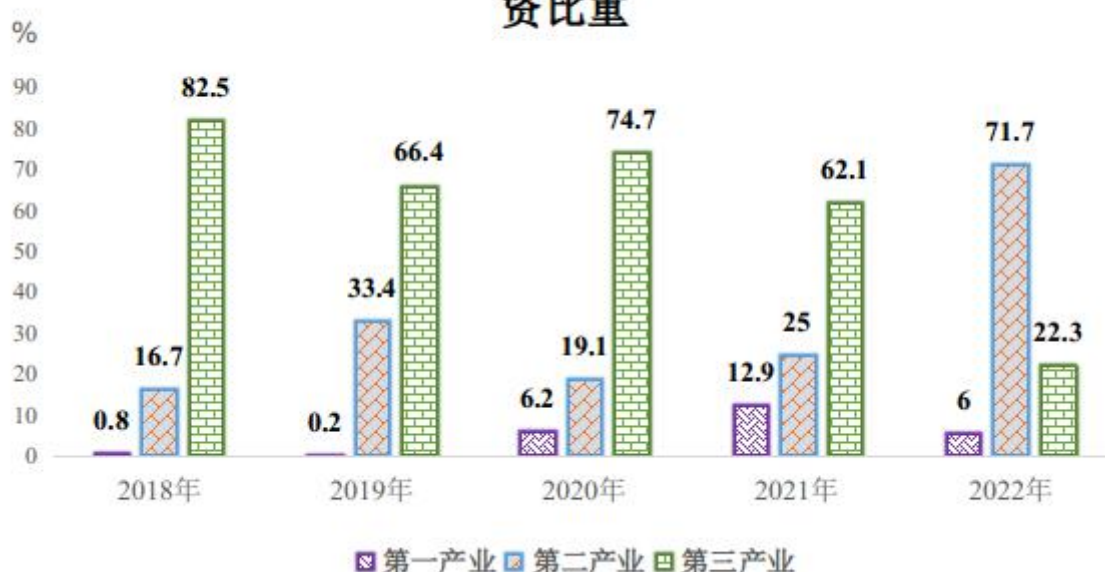
图7 2018年-2022年三次产业投资占固定资产投资比重

全年房地产投资69976万元，比上年下降68.9%，其中：住宅投资35748万元，比上年下降79.0%；商业用房投资33935万元，比上年下降34.1%。房屋施工面积928939平方米，比上年下降47%，其中住宅669235平方米，比上年下降51%。房屋竣工面积78892平方米，比上年下降67.2%，其中住宅41998平方米，比上年下降82.4%。商品房销售面积43099平方米，比上年下降85%，