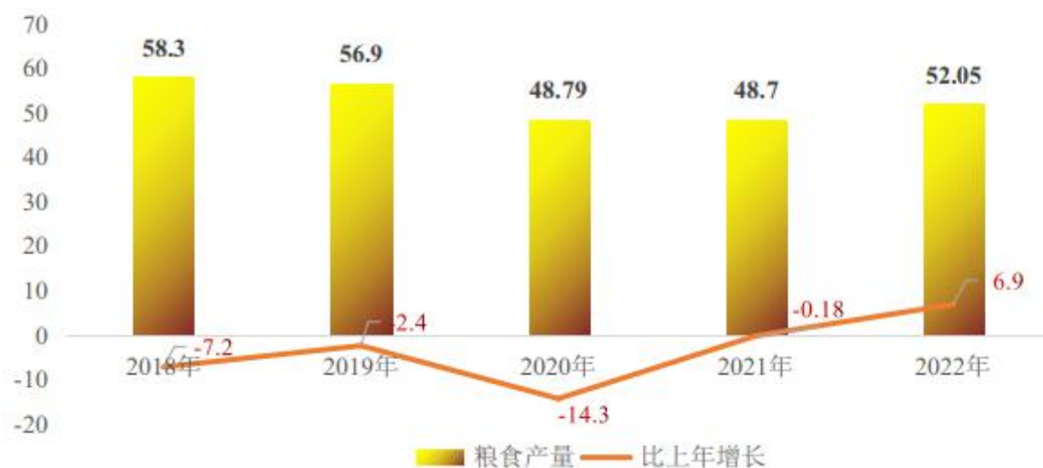
表3 2022年莎车县主要农作物产品产量